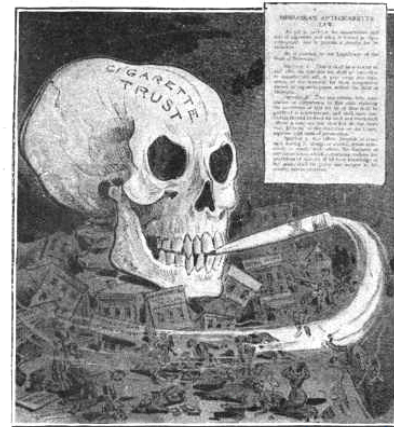
Judge. [New York.] The Deadly Cigarette. Wisconsin, Nebraska and Indiana all make it a misdemeanor to sell cigarettes or to have them in one's possession. Let every other State do likewise.

Avec l'été et les vacances qui arrivent, nous allons avoir un peu plus de temps pour nous plonger dans des lectures. Les vacances elles seront probablement en Suisse cette année, au bord de nos lacs ou sur nos montagnes. Si des masques nous protègent du Covid-19, les masques de fumée de l'industrie du tabac et de la nicotine nous empêchent souvent de comprendre l'action du lobby du tabac, en général bien sûr, mais dans notre pays en particulier. Pour cela, AT Suisse veut, cette année, vous proposer quelques conseils de lecture pour l'été. Plusieurs de ces lectures sont en anglais seulement, c'est donc aussi une belle occasion de rafraîchir nos connaissances linguistiques.